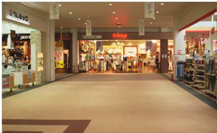
■ イベントスペース MORUE A棟 北側入口メイン通路内